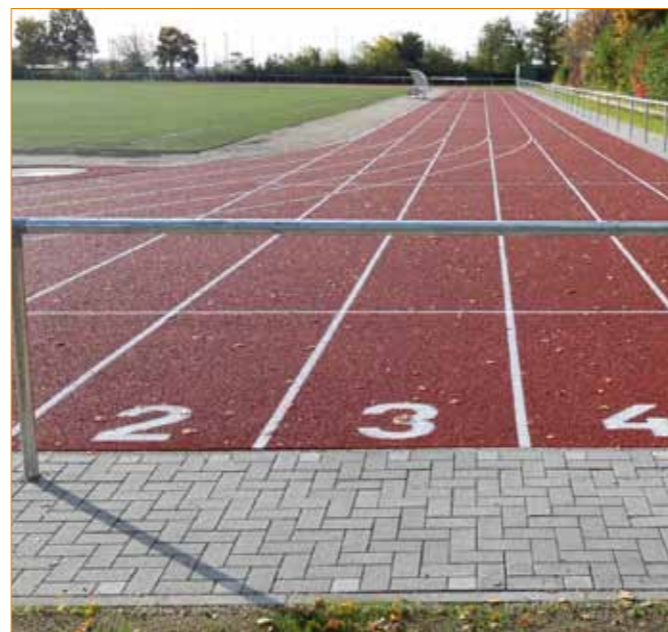
Bild oben: Wohnungen nach den Kriterien des sozialen Wohnungsbaus in der Neugasse 31 Bild unten links: Gesundheitszentrum „Oberer Schnetzweg“, Bild unten rechts: Die sanierte 400-Meter-Laufbahn

Über gute Nachrichten durften sich die Leichtathleten unseres TV Maikammer und die Schülerinnen und Schüler unserer örtlichen Schulen freuen. Die in Kunststoffausführung sanierte 400-Meter-Laufbahn und die leichtathletischen Anlagen konnten für den Sportbetrieb nach nur sechs Monaten Bauzeit freigegeben werden. Die sanierten Anlagen waren 1986 zusammen mit dem Sportplatz in Betrieb gegangen. Ein Neubau war dringend erforderlich. Die neue Anlage bietet nun für den Sportbetrieb optimale Bedingungen. Der TV Maikammer ist mit rd. 1.300 Mitgliedern der größte Verein unserer Ortsgemeinde und Hauptnutzer der Anlage. Die Sanierungskosten von rd. 800 Tsd. Euro wurden durch das Land mit rd. 184 Tsd. Euro gefördert. Unsere Ortsgemeinde durfte sich des Weiteren über eine großzügige Spende des TV Maikammer in Höhe von 60 Tsd. Euro freuen.