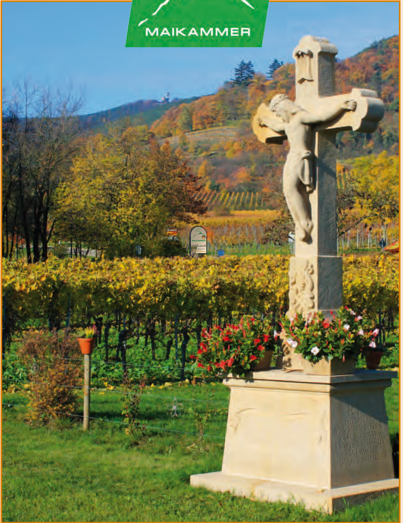
27. Jahrgang, Dezember 2019